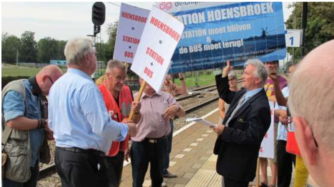
Eerder dit jaar boden buurtbewoners al een petitie aan wethouder Aarts aan.