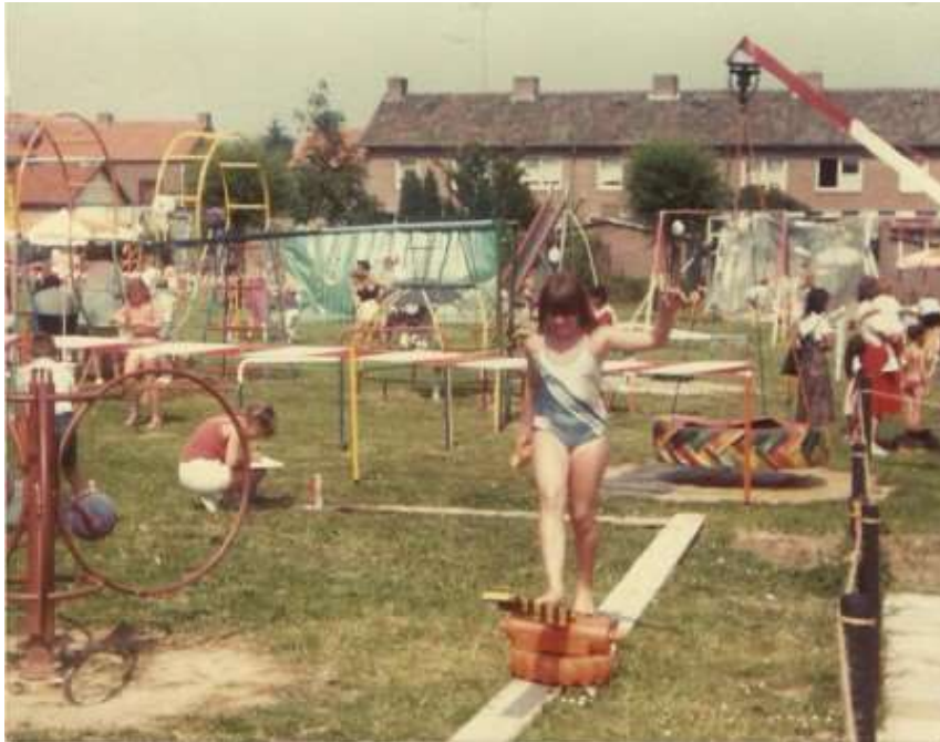
De oude speeltuin kunnen veel Nieuw-Lotbroekers zich nog goed herinneren.